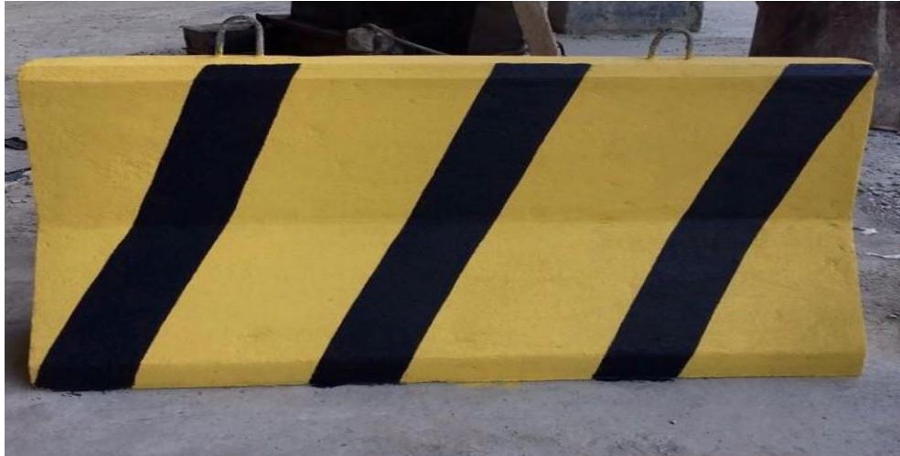
Figura 3: Barreira de concreto armado tipo “Malote”